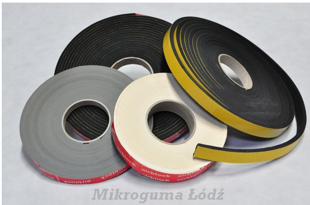
Różne kolory - profile

JAK ODCZYTYWAĆ STRONĘ Z KLEJEM? Strona z klejem oznaczona jest literą K. Wymiar po lewo to zawsze szerokość. Przykład 1: 10 K x 5 mm - szerokość uszczelki 10 mm, wysokość uszczelki 5 mm, Przykład 2: 15 K x 20 mm - szerokość uszczelki 15 mm, wysokość uszczelki 20 mm.