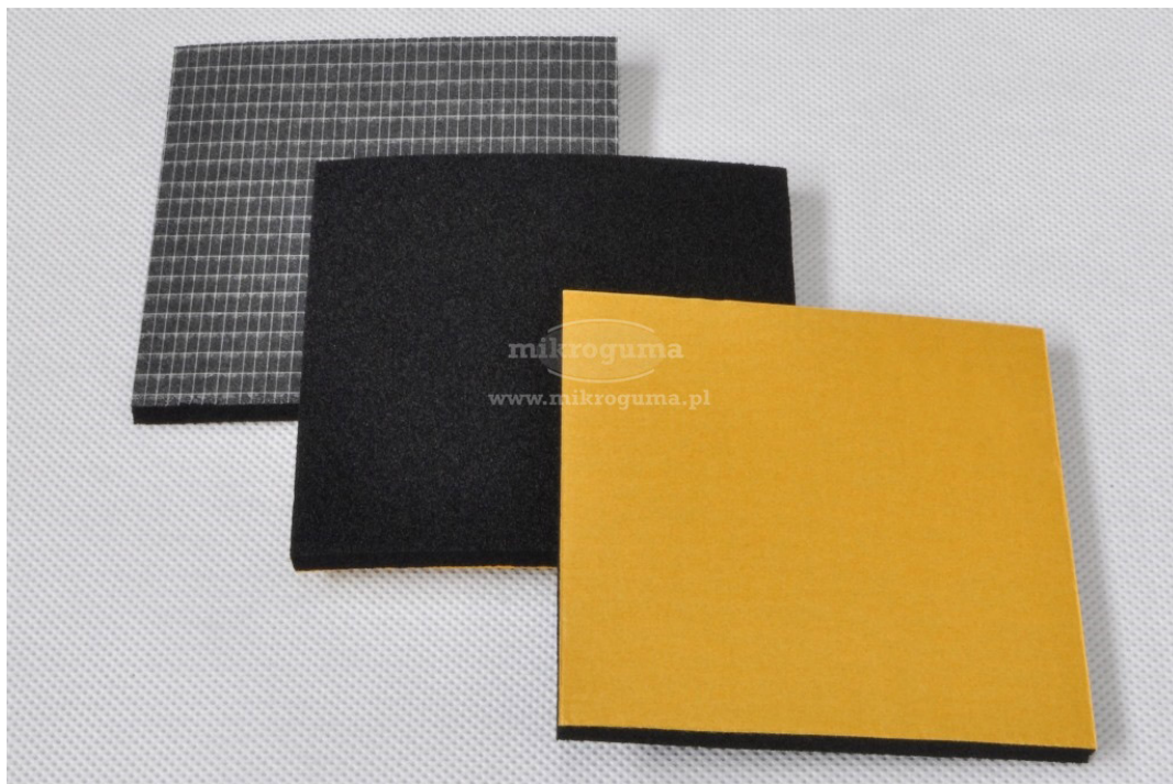
Detale wycinane z pianki