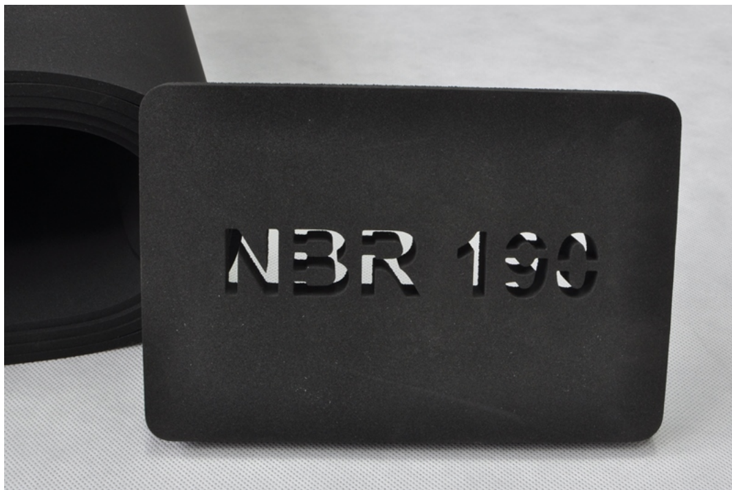
Detal z Mikrogumy NBR