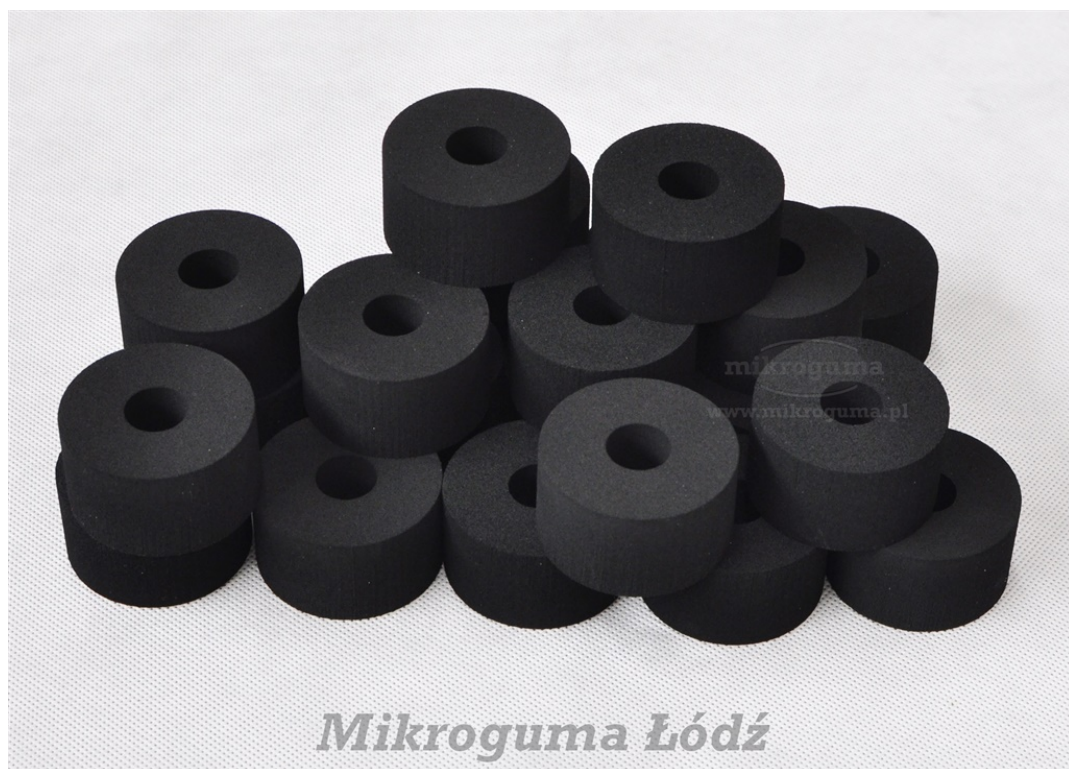
Rolki z pianki EPDM 205