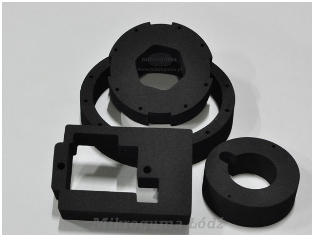
mikrogumy EPDM 130