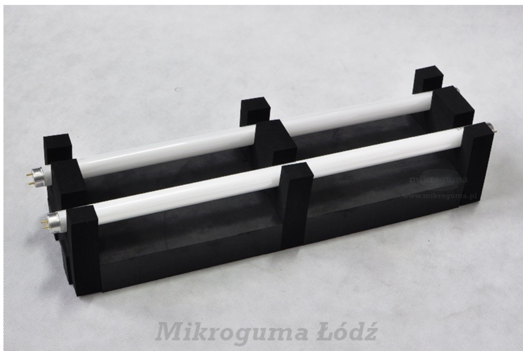
Podpory wykonane z