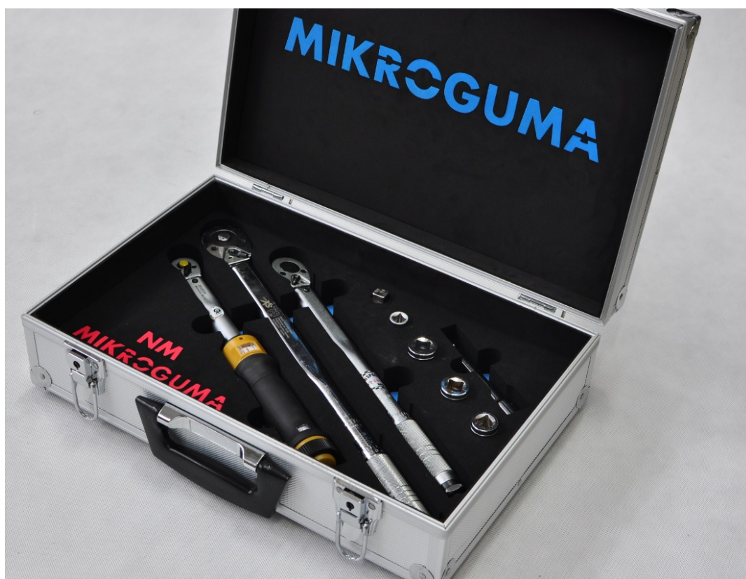
wykonana z pianki EPDM