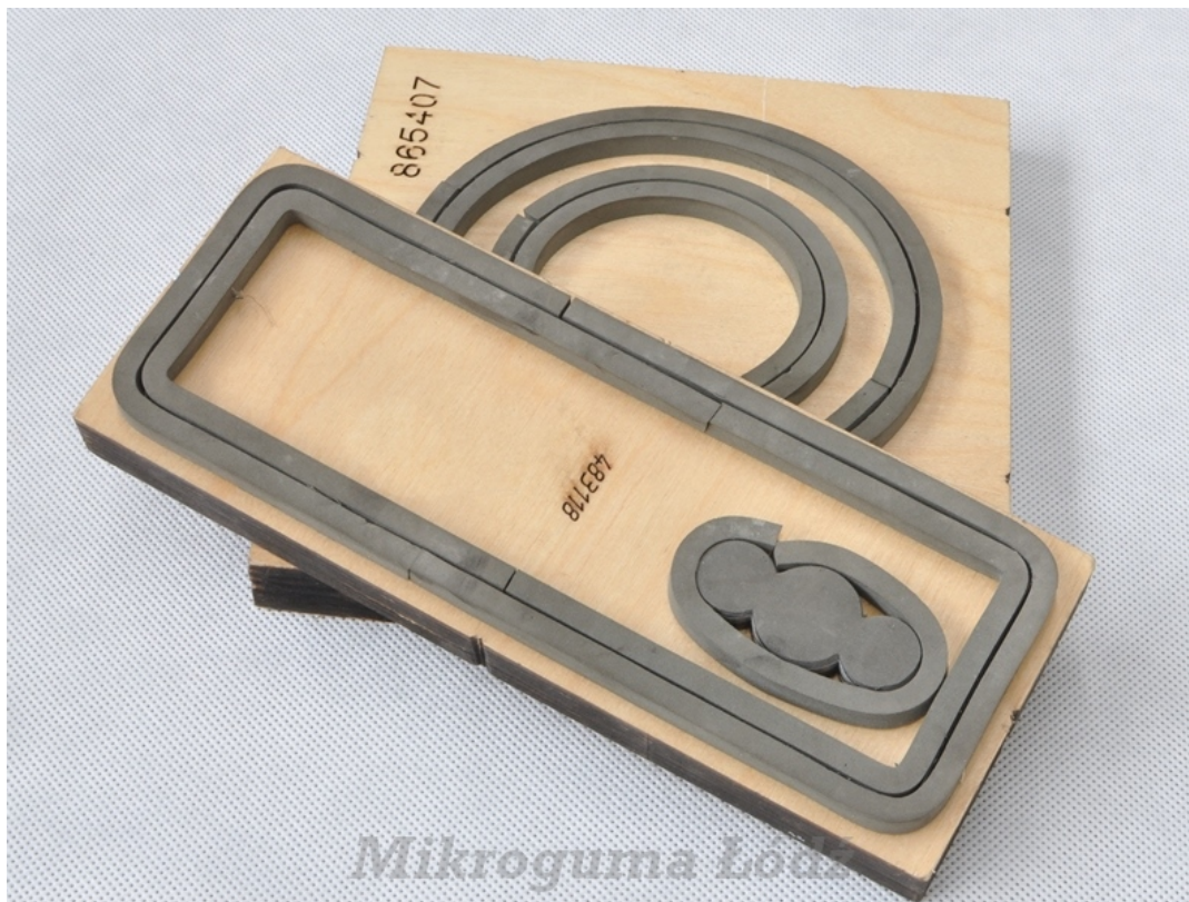
305 - jako wypychacze